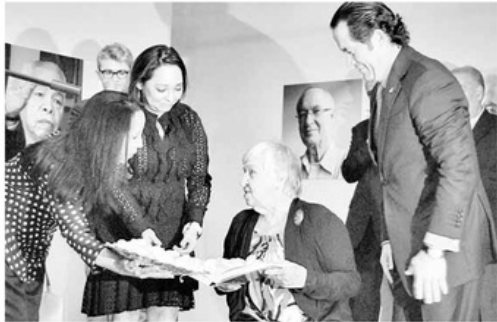
Durante la presentación del libro, uno de los momentos emotivos